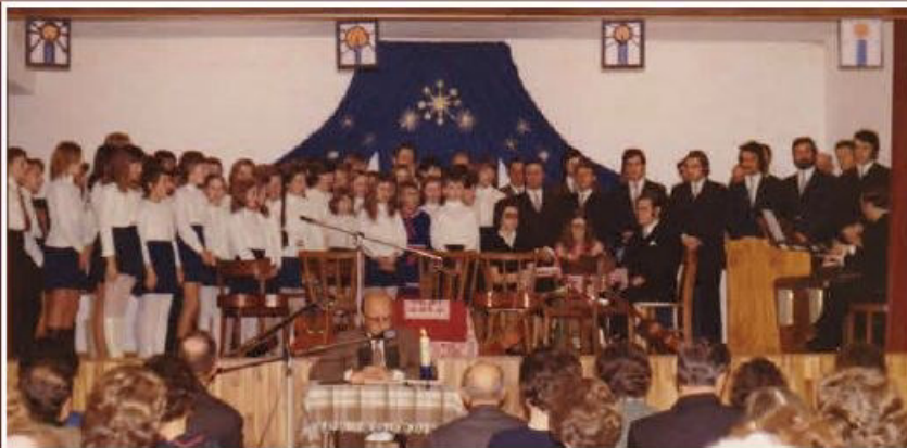
Der MGV mit dem Schülerchor Wallsee beim Weihnachtssingen im Gasthaus Sengstbratl