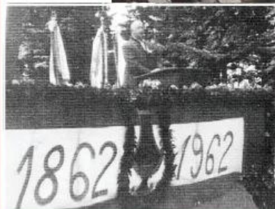
Das erste dokumentierte Bestandsjubiläum „100 Jahre MGV“.