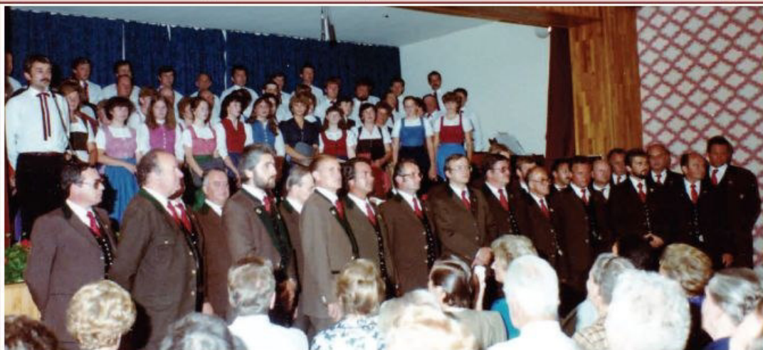
Bühne im Gasthaus Sengsbratl

1983 Konzert mit „Polizeichor Klagenfurt“ u. Kirchenchor Sindelburg