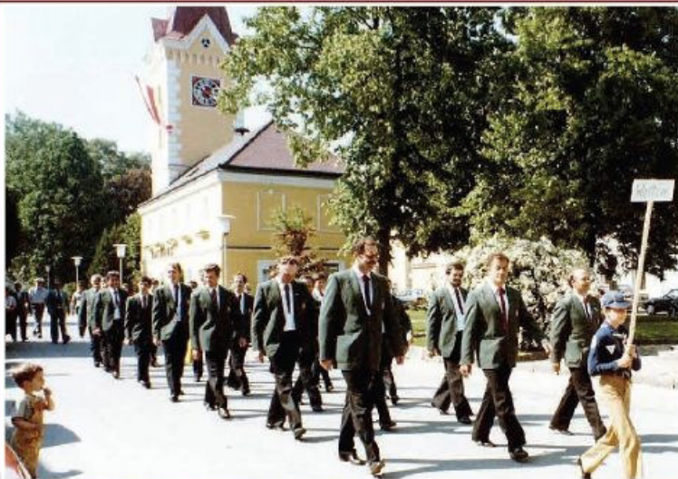
MGV - Einmarsch in den Schlosspark zum Festakt.