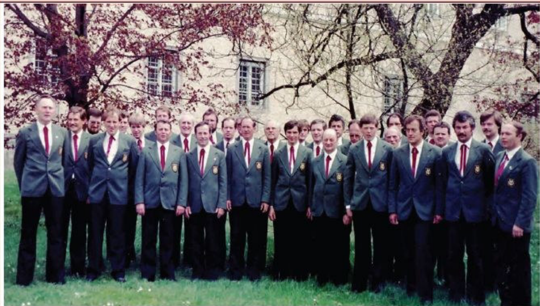
Der MGV erhält die Beurteilung „Sehr gut“ beim Wertungssingen.