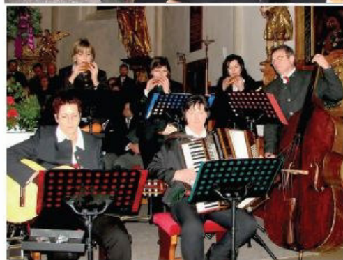
Die Mostviertler Landlpfeifer