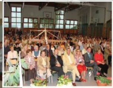
Die Hl. Messe am Bauernkirtag wird vom „Gemischten Chor“ Velden gesanglich umrahmt.