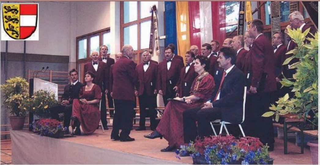
Eine gelungene Veranstaltung mit vielen Besuchern.