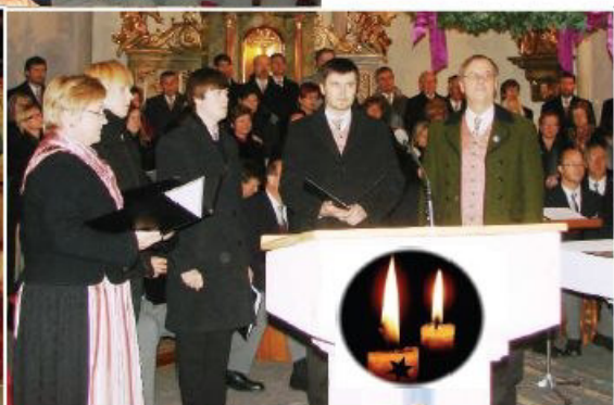
Der Familiengesang Wolf