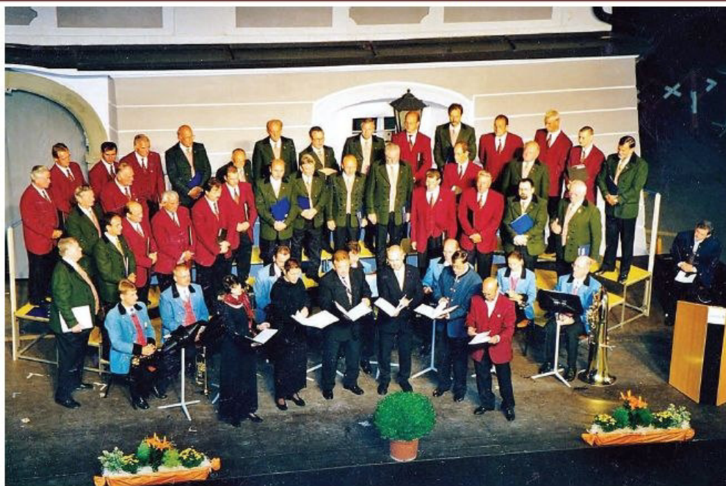
Mitwirkende: MGV-Haag, Ensemble der Stadtkapelle Haag, NÖ. Lehrerquartett und MGV-Wallsee-Sindelburg