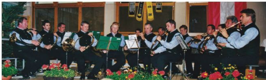
Der Jagdhornbläserverein Windhag bei Waidhofen