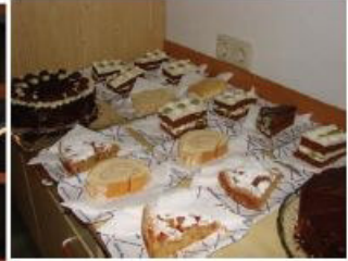
Die Sängerfrauen sorgen wie immer für die „Gaumenfreuden“ der Gäste mit köstlichen Mehlspeisen.